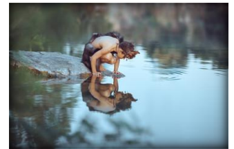
8 se contempler