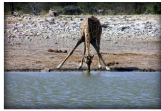
6 se désaltérer