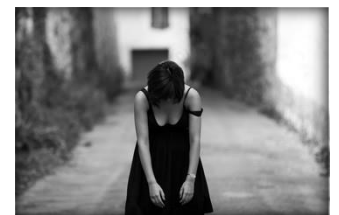
16 se décourager