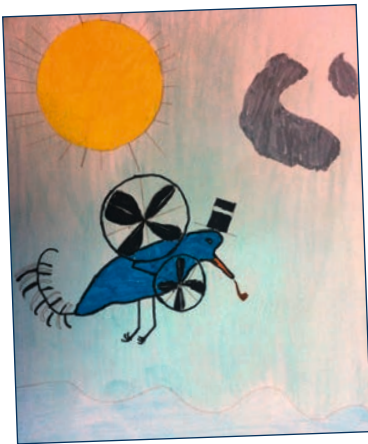
L'oiseau à hélices.