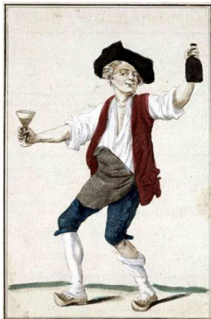
Doc 3 : J' suis du Tiers-Etat , 1789.

Cette annonce est faite dans chaque église du royaume. Chaque ordre se réunit et rédige son propre cahier de doléances (ses aspirations, ses critiques, ses propositions...)