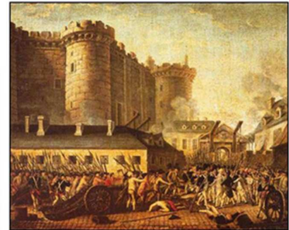
Doc t : La prise de la Bastille le 14 juillet 1789

ARTICLE I : Les hommes naissent et demeurent libres et égaux en droits. [...]