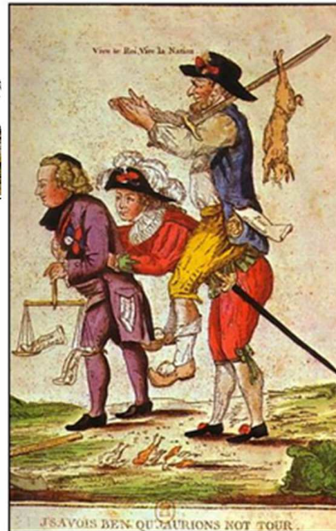
Doc t : Estampe - anonyme - 1789 - BNF