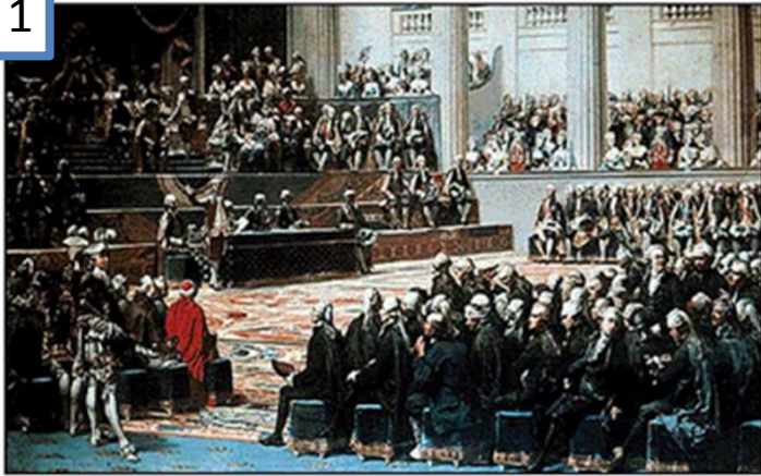
Doc 1 : Séance d'ouverture des Etats Généraux - 5 mai 1789 - Versailles

Sa majesté désire que des extrémités de son royaume et des habitations les moins connues chacun fût assuré de faire parvenir jusqu'à elle ses vœux et ses réclamations. Louis XVI